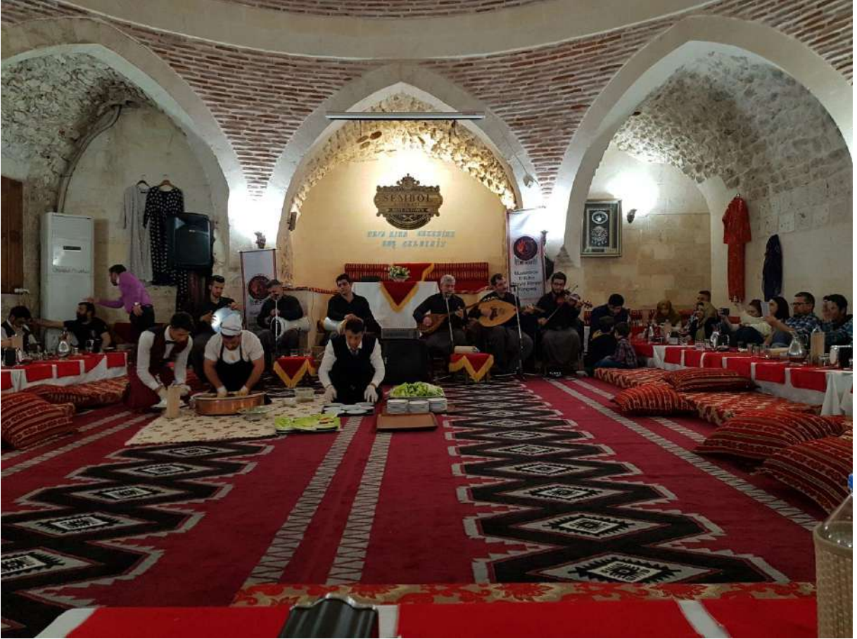
Kongrenin son günü yemekli sıra gecesi eğlencesinden bir kare