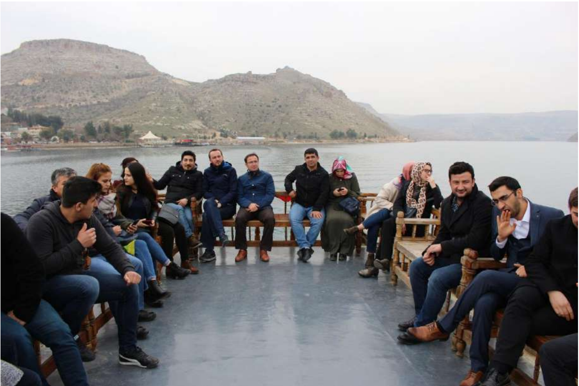
Değerli katılımcılarımıza yönelik Halfetiye düzenlediğimiz gezideki tekne turundan bir kare

Kongrenin tüm fotoğraflarına facebook sayfamıza üye olarak ulaşabilirsiniz. İKSAD Kongre topluluğu https://www.facebook.com/groups/518107318534159/?fref=nf