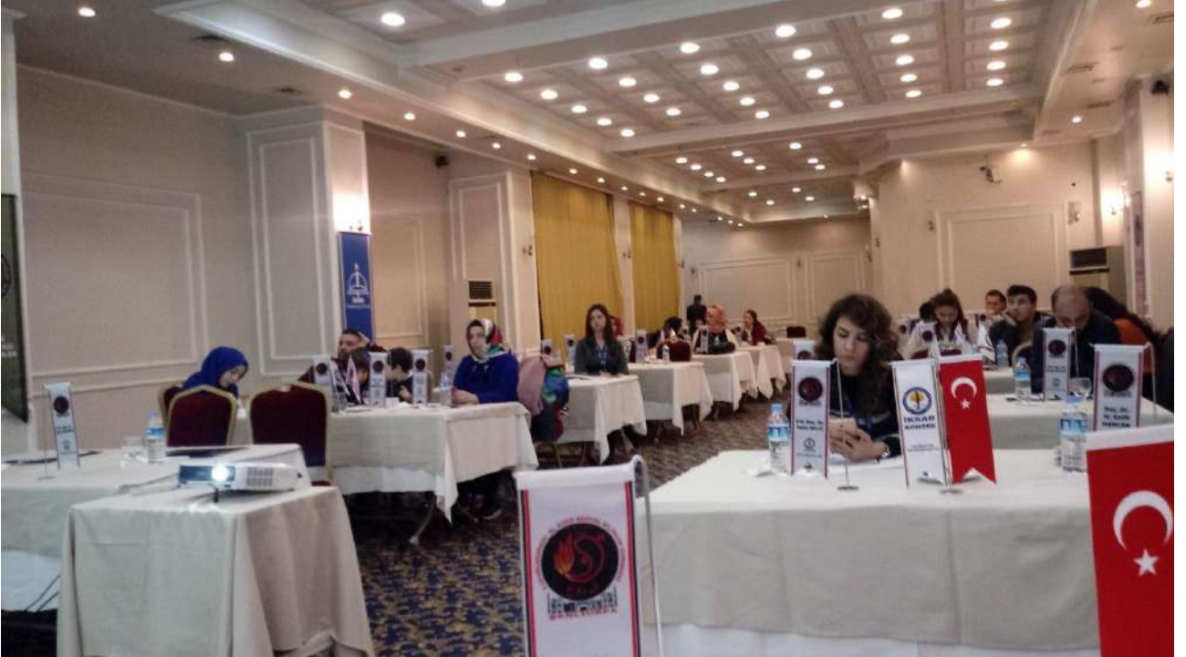
1 Nolu Salon oturumundan bir kare