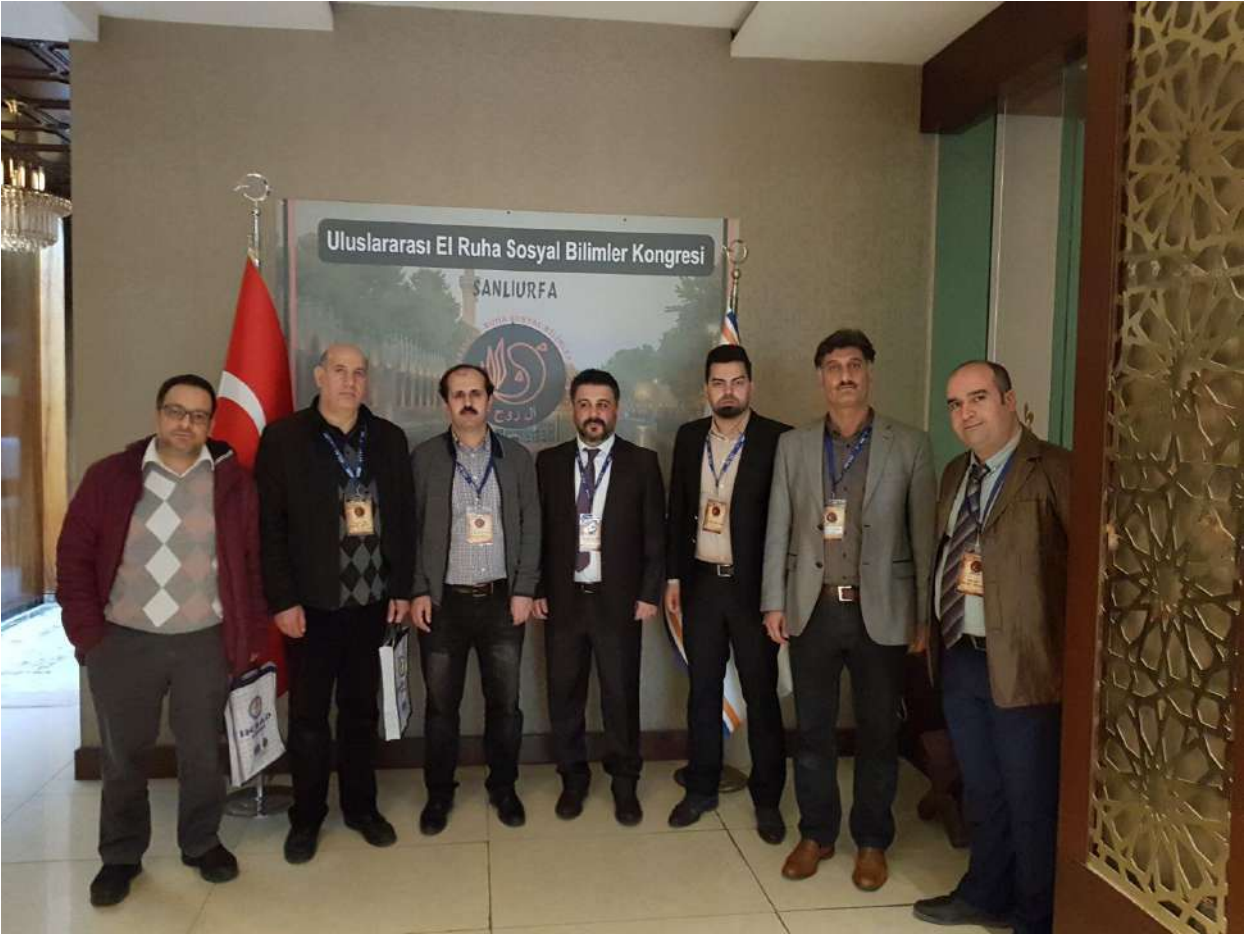
Oturum sonrası hatıra fotoğrafı